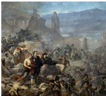
"El gran dia de Girona" de Ramon Martí Alsina

vegada després de la Guerra Civil, el quadre tornarà a ser exhibit públicament de manera permanent. Després d'un llarg període de recerca, dut a terme al llarg d'aquests dos darrers anys, s'ha aconseguit localitzar nombrosos esbossos i dibuixos d'aquesta obra, molts dels quals es troben en mans de col·leccions particulars. L'exposició mostrarà més de 50 obres de Martí Alsina directament relacionades amb El Gran dia de Girona .