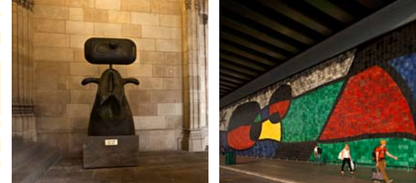
03 Dona Ajuntament de Barcelona L3 Liceu / L4 Jaume I 04 Mural de l'aeroport Aeroport de Barcelona (fora del mapa) Terminal 2