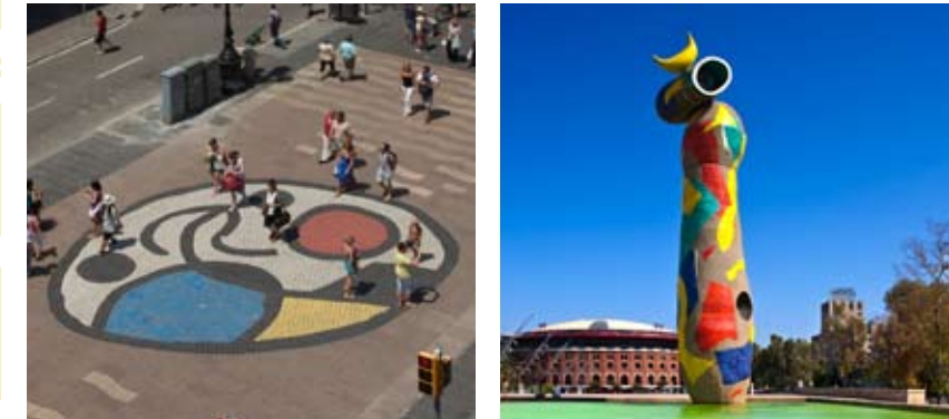
01 Mosaic del Pla de l'Os La Rambla L3 Liceu 02 Dona i ocell Parc de Joan Miró (fora del mapa) L1 L3 Espanya