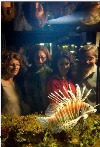
Imatge: Andreu Adrover

Exposició temporal inclosa en l'entrada al Museu