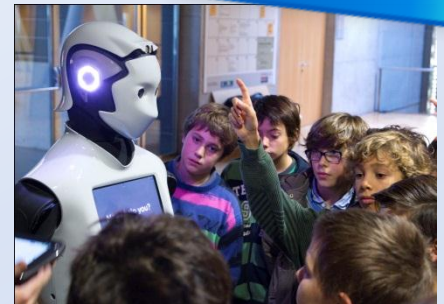
Imatge: Jordi Nieva

Horari: dies 8 i 9, a les 12.00 i 17.00 h | Destinataris: famílies, nens i nenes a partir de 5 anys | Preu: activitat especial inclosa en l'entrada general