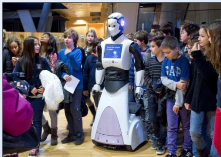
Imatge: Jordi Nieva