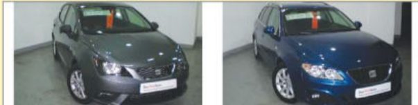
SEAT IBIZA 1.2 TSI 85CV REFERENCE GASOLINA 2013 - 370 KM 10.900 eu SEAT EXEO ST 2.0 TDI CR 143 CV STYLE ECOMOTIVE, DIÈSEL 2013 - 28.800 KM 18.500 eu

AUTO COMERCIAL MAAM T. 638 418 410 vo@maam.es - www.maam.es