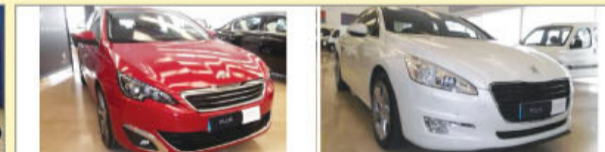
PEUGEOT 308 ALLURE 1.6HDI 115 DIÈSEL 2013 - 28.525 KM 18.900 eu PEUGEOT 508 GT2.2HDI204 DIÈSEL, AUTOMÀTIC 2013 - 18.500 KM 24.900 eu

AUTOMOVILES GRUPO 3DARC T. 93 274 46 26 - www.tresdarc.com