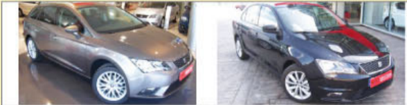
SEAT LEON ST TSI 140 GASOLINA 2013 - KM 0 20.000 eu SEAT TOLEDO 1.6 TDI 105CV REFERENCE DIÈSEL 2013 - KM 0 14.600 eu

TAES MOTOR T. 932 749 980 www.taesmotor.seat.es