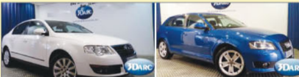
VOLKSWAGEN PASSAT 2.0 TDI 110CV EDITION PLUS, DIÈSEL 2010 - 36.000 KM 14.900 eu AUDI A3 SPORTBACK 2.0 TDI, 140CV DIÈSEL 2010 - 69.000 KM 18.900 eu

RENAULT OCASIÓN GRUPAUSER Oferta vàlida a Grup Auser fins al 31/10/2014 www.auser3000.com