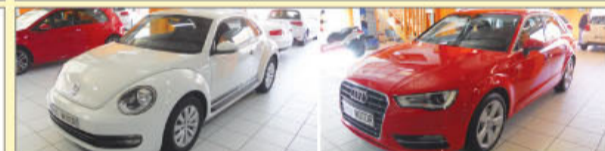
VOLKSWAGEN BEETLE 1.6TDI 105CV BEETLEMANIA 2014 - KM 0 21.600 eu AUDI A3 SPORTBACK 2.0TDI 150CV AMBITION 2013 - 12.000 KM 26.900 eu

Badal81 CITROËN ESPAÑA BADAL T. 932 274 669 - www.citroenbadal.citroen.es