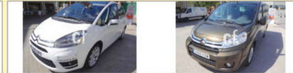
CITROËN C4 PICASSO 1.6 HDI 110CV EXCLUSIVE, DIÈSEL, AUTOMÀTIC 2012 - 35.000 KM 19.500 eu CITROËN JUMPY 2.0 HDI 160CV MILLENIUM L DIÈSEL, AUTOMÀTIC 2014 - 600 KM 27.900 eu

GARAGE RIO Molins de Rei - Sant Boi del Llobregat T. 93 652 62 50 - www.garagerio.es