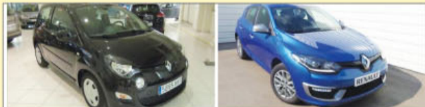
RENAULT TWINGO 1.5DCI EMOTION ECO2 DIÈSEL 2012 - 24.599 KM 9.500 eu RENAULT MEGANE 1.5DCI GT STYLE DIÈSEL 2014 - 16 KM 16.800 eu

NOU MOTOR T. 938 723 332 www.noumotor.com