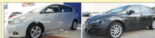
TOYOTA VERSO 2.0 D4D ACTIVE 5PL DIÈSEL, 126 CV 2010 - 63.000 KM 12.995 eu SEAT LEON 1.6 TDI ECOMOTIVE STYLE DIÈSEL, 105 CV 2011 - 72.000 KM 9.995 eu

MOTORSOL IMPORT C/ Manso, 9 - Barcelona T. 93 289 67 67 www.motorsolimport.es