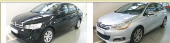
CITROËN C-ELYSEE 1.6 VTI SEDUCTION 119CV, GASOLINA 2013 - 15.665 KM 9.900 eu CITROËN C4 1.6E-HDI COLLECTION 2014 - 6.057 KM 15.900 eu

Servisimó T. 938 052 117 - www.servisimo.es