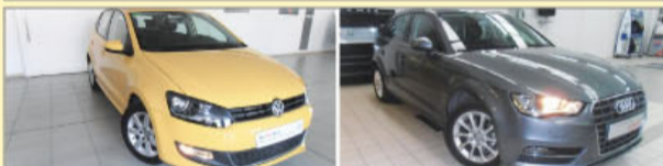
VOLKSWAGEN POLO 1.6 TDI SPORT DSG 90CV DIÈSEL 2010 - 39.000 KM 12.070 eu AUDI A3 SPORTBACK 1.6 TDI ATTRACTION ED ESPEC 105CV, DIÈSEL 2013 - 32.000 KM 19.930 eu

EUTRASA T. 617 374 811 - www.eutrasa.com C/Catalunya, 39 Les Franqueses del Vallès