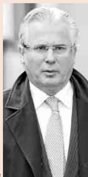
El juez Baltasar Garzón.

La nota concluye: “Si queremos que la Justicia funcione bien, hay que procurar que actúe libremente, preservar la presunción de inocencia de todo el mundo, evitar los juicios paralelos y acatar las resoluciones”.